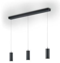
HELLI Pendant lamp 51.511.xx 6 x 8 W LED, 2.700 K, 4.280 lm, EEL-E