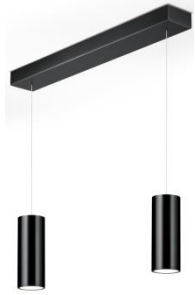
HELLI Pendant lamp 51.506.xx 4 x 8 W LED, 2.700 K, 4.280 lm, EEL-E