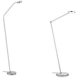
THEA-S-Flex und THEA-S 41.975.xx und 41.980.xx Stehleuchte / floor lamp 10,8 W LED, 2.700 K, 1100 lm