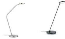
THEA-T-Flex und THEA-T 61.623.xx und 61.626.xx Tischleuchte / table lamp 10,8 W LED, 2.700 K, 1100 lm