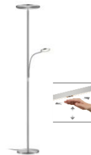
AURA-L 41.974.xx Fluter mit Lesearm / Uplight with reading lamp 1 x 43 W LED, 2.700 K Warmton 5.100 lm Leser: 1x 10,8 W LED, 2.700 K, 1.100 lm