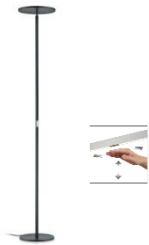
AURA 41.973.xx Fluter / Uplight 1 x 43 W LED, 2.700 K Warmton 5.100 lm