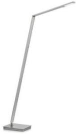
JULI-S 41.968.xx Stehleuchte / floor lamp 10,8 W LED, 2.700 K, 1200 lm