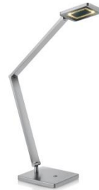
61.620.xx Tischleuchte / table lamp 7 W LED, 3.000 K, 1.190 lm Energieeffizienzklasse D energy efficiency class D